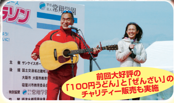
前回大好評の 「100円うどん」と「ぜんざい」の チャリティー販売も実施

3.11子どもanimoプロジェクトとは NPO法人ハート・オブ・ゴールドが提唱する東日本大震災復興支援活動。地震や津波で被災した学校の復興に協力し、子どもたちが1日も早く元通りの学校生活に戻れるよう、学校と話し合って必要な支援を継続しています。昨年は、年数回の校外学習と卒業アルバムを支援しました。animo(アニモ)は、スペイン語で「ガンバレ」という意味です。